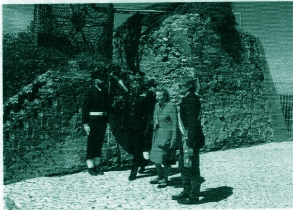
La deposizione della corona d'alloro in memoria dei caduti